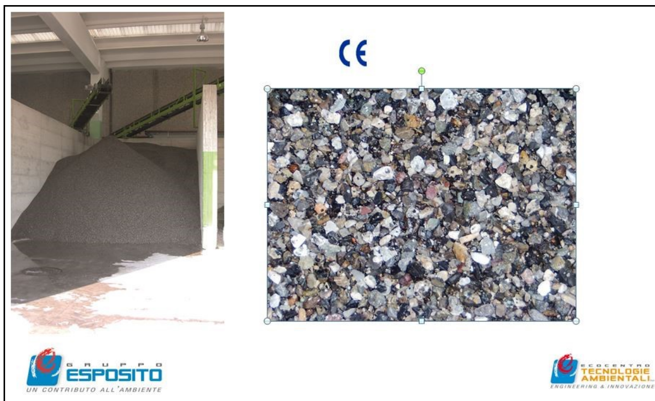
Fig. 2. Denominazione commerciale del prodotto: Ghiaino 2/8 mm