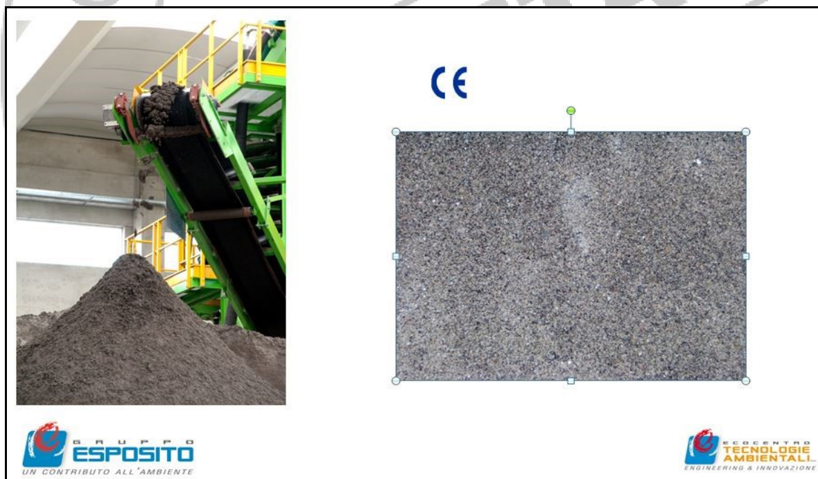
Fig. 1. Denominazione commerciale del prodotto: Sabbia 0,063/2 mm